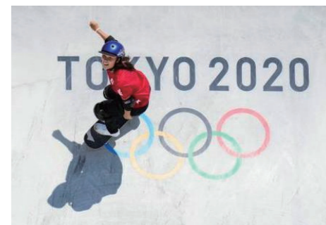
オリンピック正式種目に