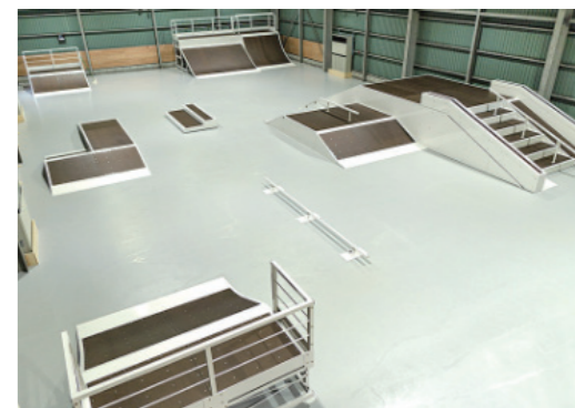
屋内スケートパーク