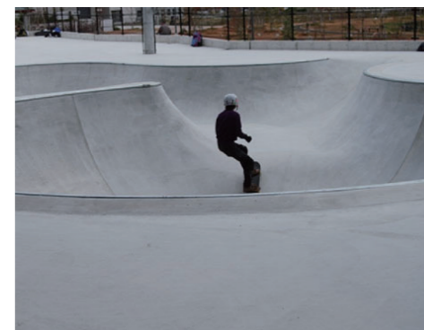
屋外スケートパーク 原池公園(堺市)指定管理ミス