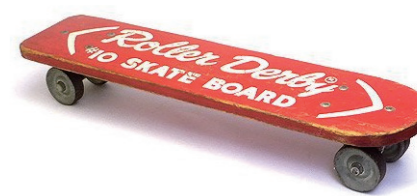
初期のスケートボード