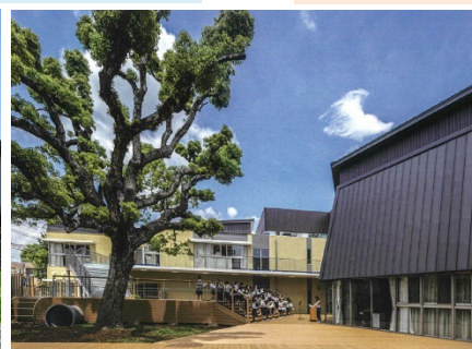
守口市立さくら小学校