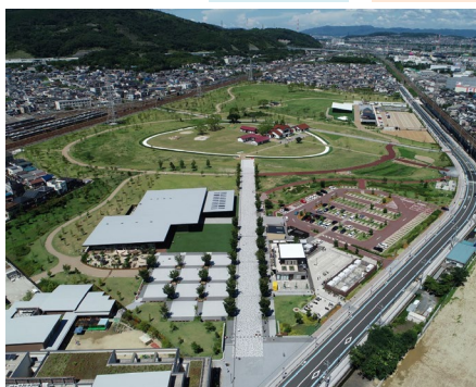
安満遺跡公園 大阪梅田ツインタワーズ・サウス