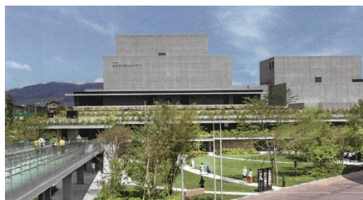
枚方市総合文化芸術センター